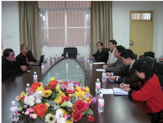
Delegasi UAD disambut oleh staf dekanat Universitas Kebangsaan Guangxi China