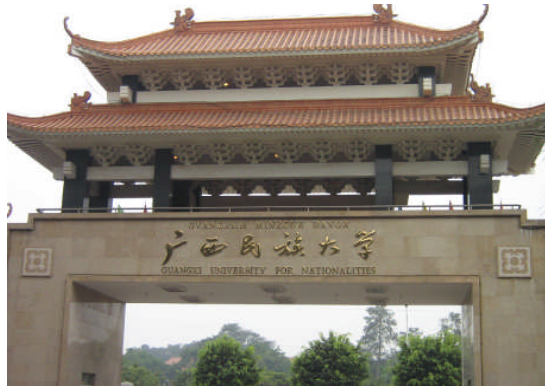
Pintu gerbang Universitas Kebangsaan Guangxi China