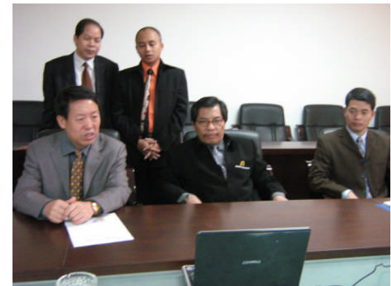
Pihak UAD dan Guangxi sedang menyaksikan pemutaran VCD tentang Company Profile UAD